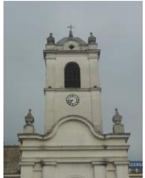
Edificio principal (Frente) y detalle de Torre y Cúpula antes de la intervención.