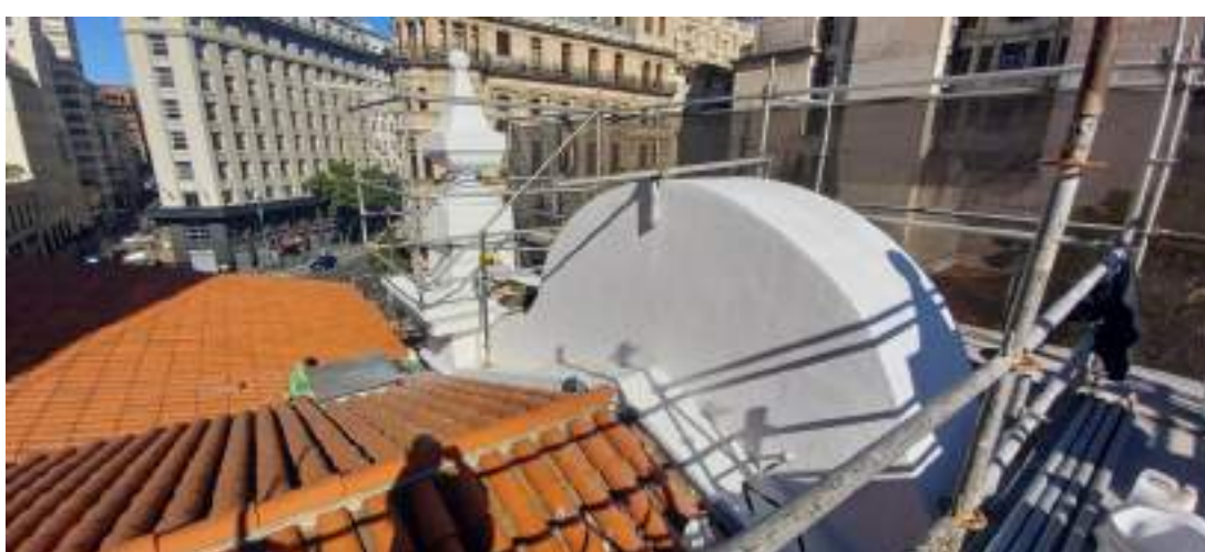
Proceso de intervención sector Contrafrente vista posterior.