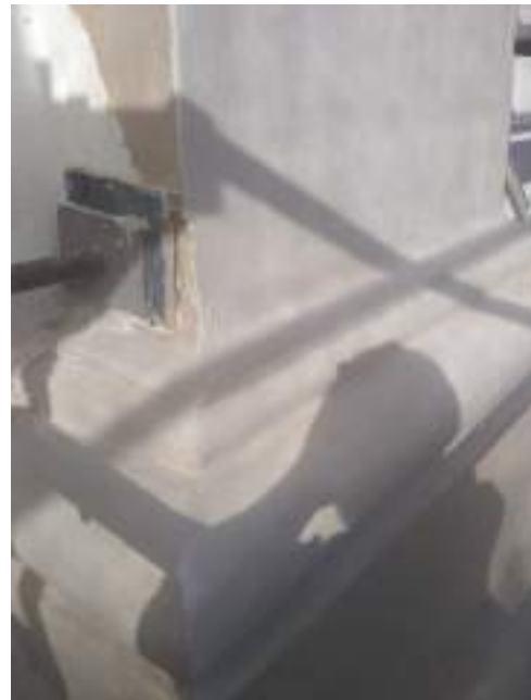
Contrafrente, sector derecho.