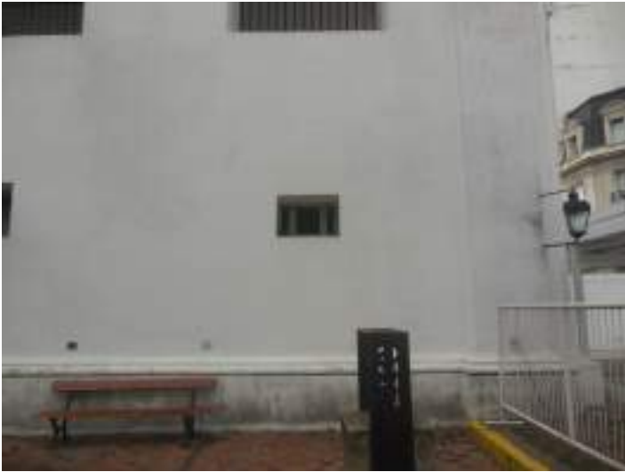
Sector antes de la intervención.