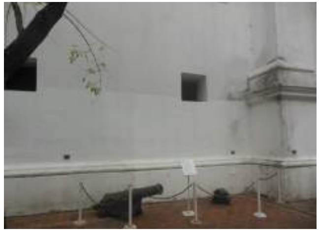
Sector antes de la intervención.