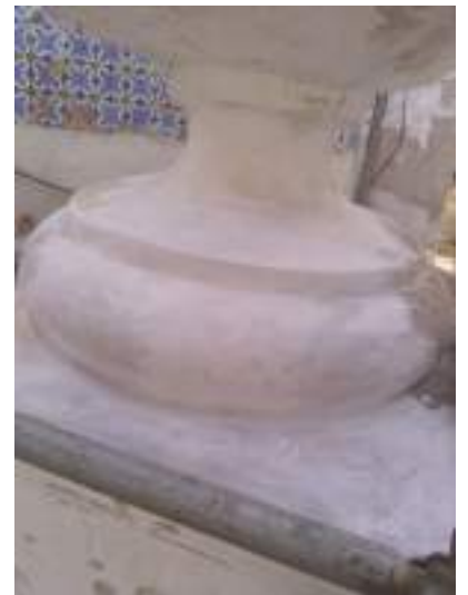
Proceso de intervención, base pináculo derecho (Torre).