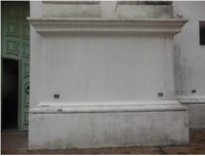
Sector antes de la intervención.