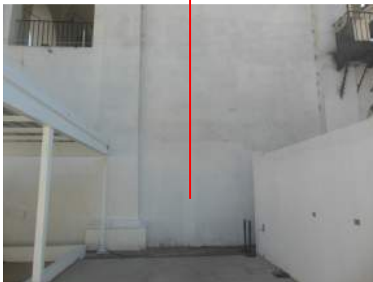
Detalle antes de la intervención.