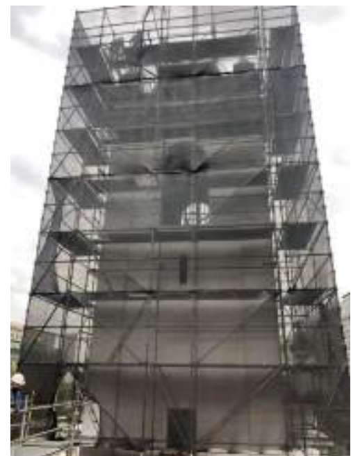
Detalle del armado de los andamios, edificio Principal y Torre (Contrafrente) .